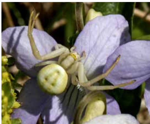
specie păianjen Misumena vatia