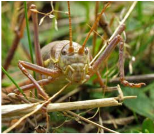
specie cosaș ordin Orthoptera

Știați că? Pe continentele Americane nu au existat albine înainte de sosirea europenilor?