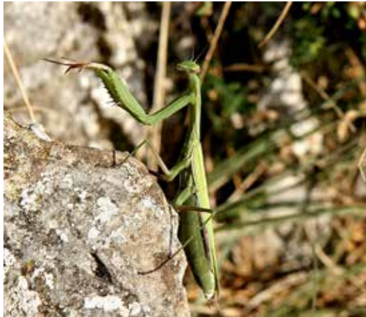
călugăriță Mantis religiosa